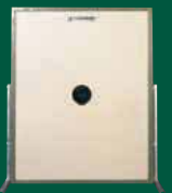
Elektronische Scheibenanlage 300 m ESA 300