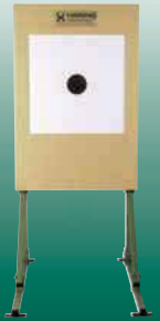
Elektronische Scheibenanlage 25/50/100 m ESA 25 ESA 50 und ESA 100