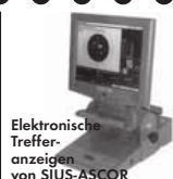
Elektronische Treffer- anzeigen von SIUS-ASCOR

Ein Begriff für perfekte Schießstand- technik