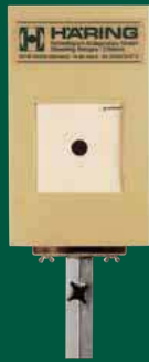
Elektronische Scheibenanlage 10 m ESA 10