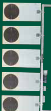
Duellanlage 25 m PA 25