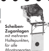
Scheiben- Zuganlagen mit mehreren Haltepunkten, für alle Montagearten

Postfach 1140 · D-35086 Battenberg Tel. (0 64 52) 93 32-0 · Fax: (0 64 52) 93 32-163 E-mail: info@johannsen.de Internet: www.johannsen.de